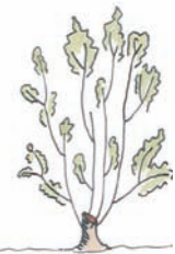
2 jaar na afzetten