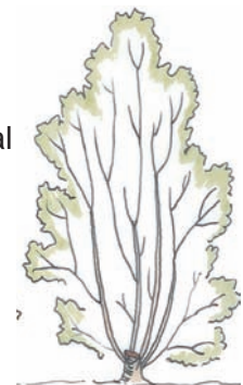
3-4 jaar na afzetten