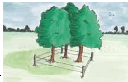
bomengroep met raster